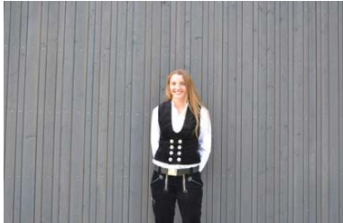
Bild: Die Zimmerin