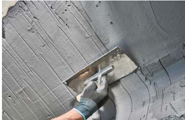
Abb.: Saint-Gobain Weber