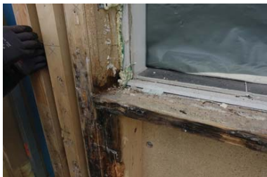
Abb.: Egle Engineering

Im Titelthema der letzten Ausgabe 2021 widmet sich die B+B in vier Beiträgen der Bauwerksabdichtung. Es wird erläutert, wie die Richtlinie zur Planung und Ausführung von flexiblen polymermodifizierten Dickbeschichtungen (FPD) in der Praxis angewendet werden kann. Ein Objektreport schildert eine interessante Flachdachinstandsetzung (mit Gründach). Ein Artikel behandelt die ATV DIN 18336 Abdichtungsarbeiten. Ein Praxistipp zur Sockelabdichtung rundet das Titelthema ab.