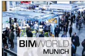
BIM World MUNICH